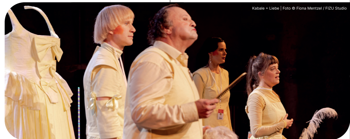
Kabale + Liebe

Ein Stück über tradierte Männlichkeitsbilder, Trauer und Familie mit einer gehörigen Portion Verrücktheit und natürlich: Musik.