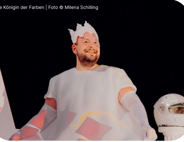
Die Königin der Farben | Foto © Milena Schilling